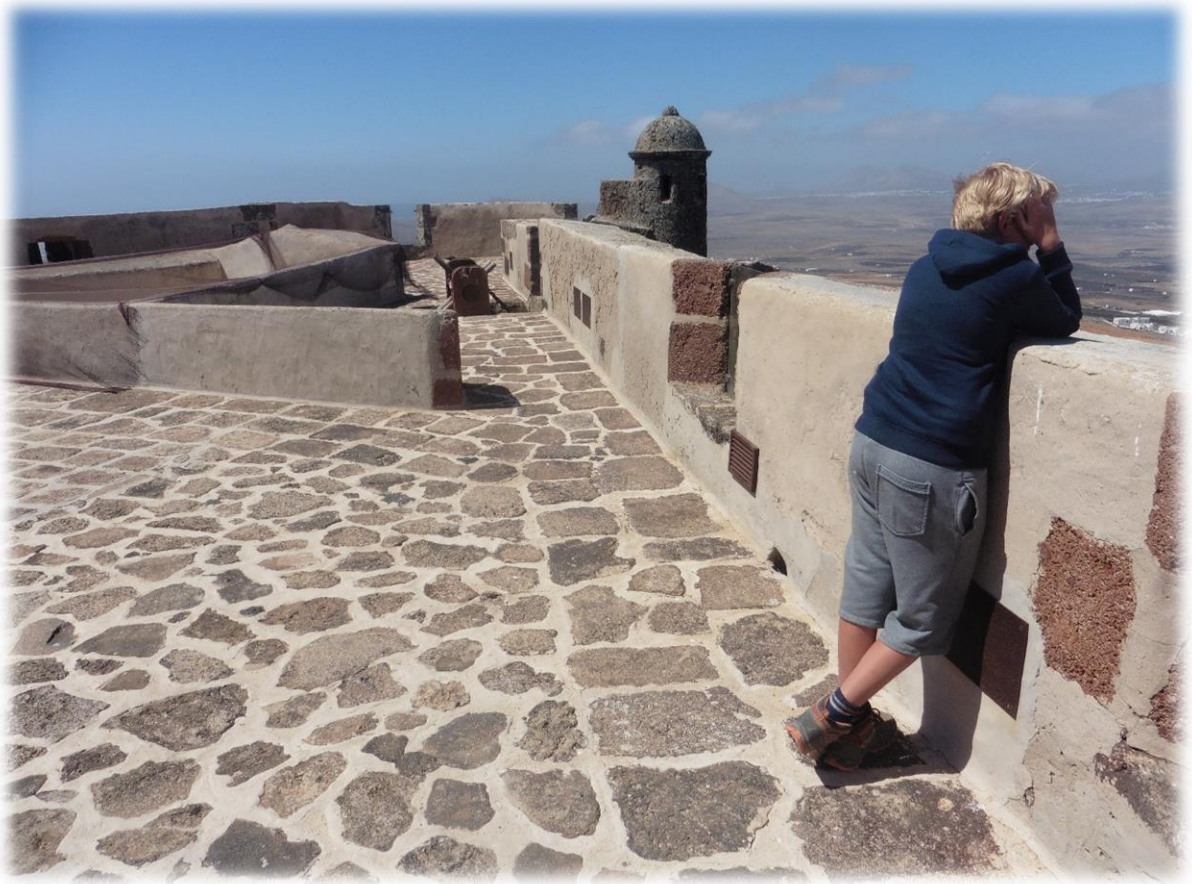
Het museum bevindt zich in een oud kasteel hoog boven op een vulkaan aan de rand van de vroegere hoofdstad Teguisé.