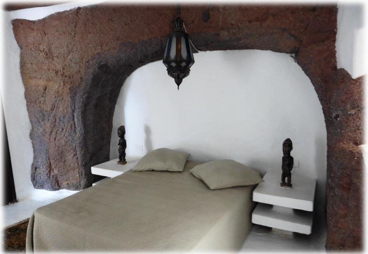
Dit is het bed waarin Omar Sharif slechts één (slapeloze?) nacht heeft verbleven.